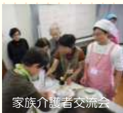
家族介護者交流会

10月の介護予防月間はもちろんのこと、日頃から地域で活躍する介護予防サポーターの皆さま。高齢者支援センターの各イベントでも、毎回たいへんお世話になっております。きめ細やかな声掛けとアットホームな雰囲気作りで、参加者の皆さまもリラックスして楽しまれていました。ありがとうございます。