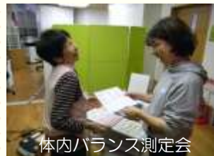
体内バランス測定会