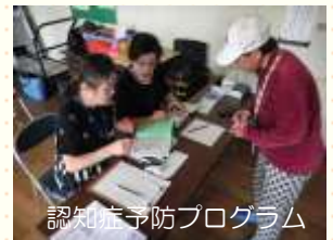
認知症予防プログラム